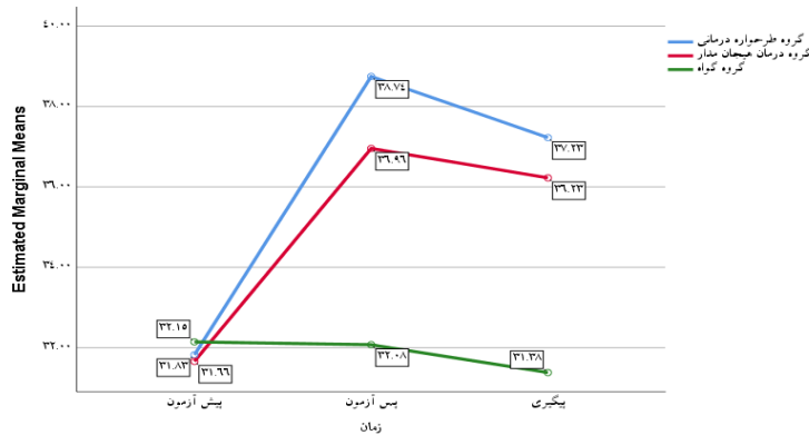
شکل ۱. نمودار رضایت از زندگی براساس زمان در گروه‌های طرح‌واره‌درمانی و رویکرد هیجان‌مدار و گواه

براساس جدول ۷، مداخلات دو گروه طرح‌واره‌درمانی و رویکرد هیجان‌مدار درمقایسه با گروه گواه بر رضایت از زندگی و امید به زندگی و تاب‌آوری اثربخش بود ( p<0/001 ). همچنین بین دو گروه طرح‌واره‌درمانی و رویکرد هیجان‌مدار، در متغیرهای رضایت از زندگی و امید به زندگی ( p=0/011 ) تفاوت معناداری وجود داشت. باتوجه به میانگین نمرات متغیرهای رضایت از زندگی و امید به