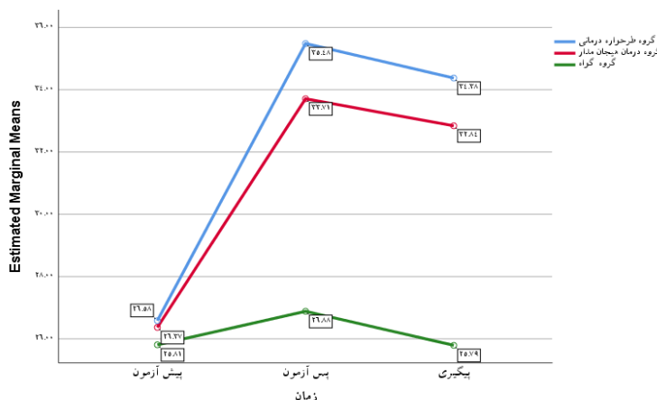
شکل ۳. نمودار امید به زندگی براساس زمان در گروه‌های طرح‌واره‌درمانی و رویکرد هیجان‌مدار و گواه